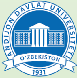
Andijan state university